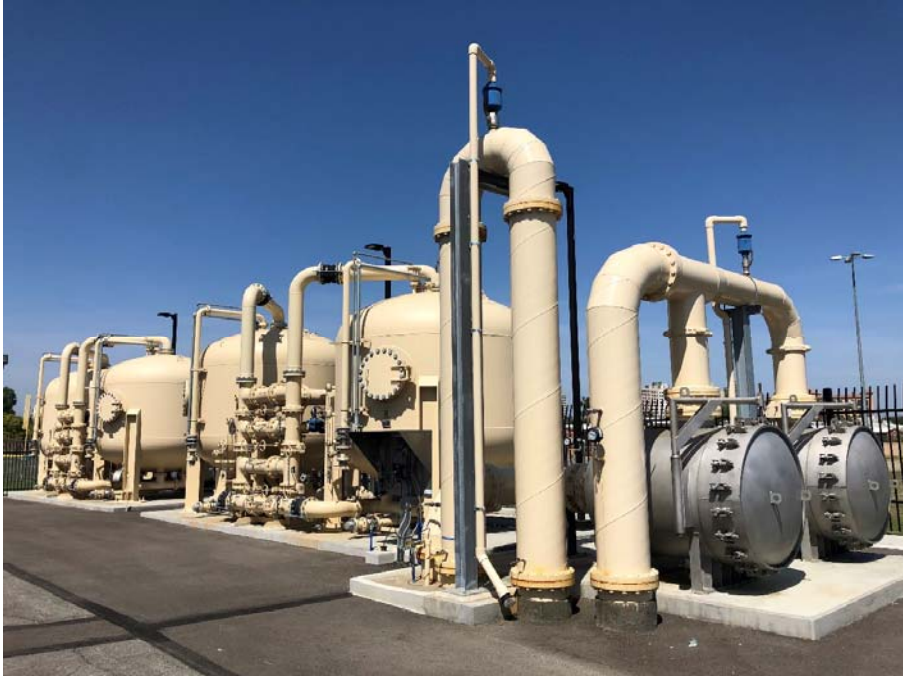
Westhaven 저수지의 PFAS 장비