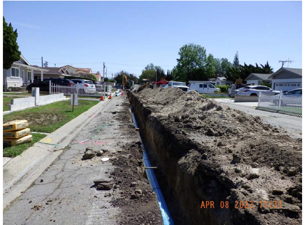
Alwood Ave-Anthony Ave 수도본관 교체(4,200 lf)